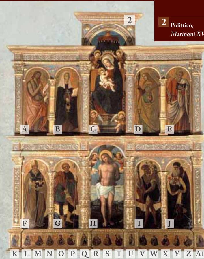
2 Polittico, Marinoni XVI sec.