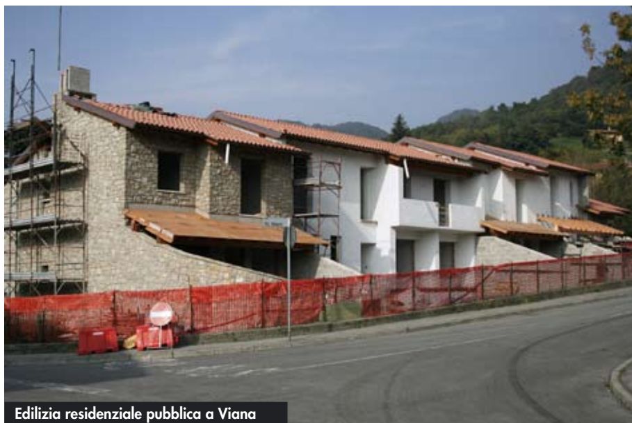
Edilizia residenziale pubblica a Viano

R. Un altro traguardo importante è stata la trasformazione dei due CSE (Centri Socio Educativi di Nembro e