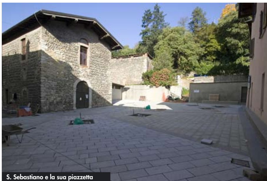
S. Sebastiano e la sua piazzetta