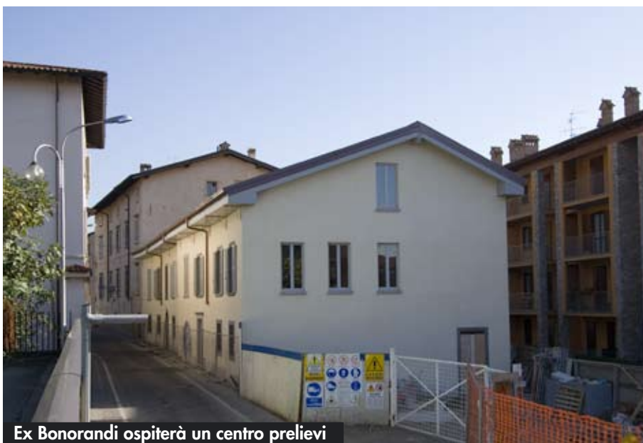
Ex Bonorandi ospiterà un centro prelievi

di Gandino) in CDD ( Centri Diurni Disabili ), trasformazione imposta dalla nuova normativa regionale e dalla dismissione della gestione ASL.