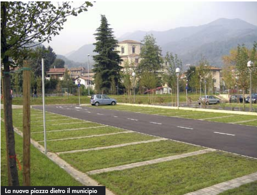
La nuova piazza dietro il municipio

L'ampliamento del parcheggio è stato reso possibile anche grazie ad un contributo a fondo perduto, ossia un finanziamento gratuito, della Regione Lombardia. Il parcheggio è pubblico, sempre aperto e gratuito. ■