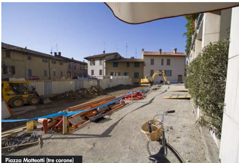
Piazza Matteotti (tre corone)